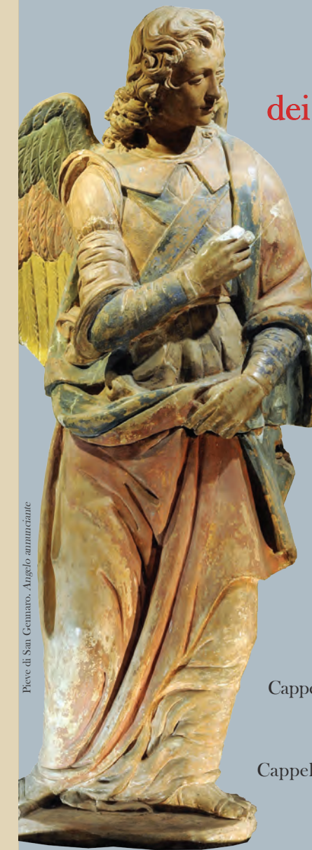
Pieve di San Genaro, Angelo annunciante

Domenica 15 Dicembre ore 15.00 Concerto di Natale a Villa Gambaro di Petrognano Domenica 29 Dicembre ore 15.00 Coro di Natale alla Cappella Santini a Camigliano